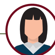
Solène GUICHEMER Monitrice - Formatrice